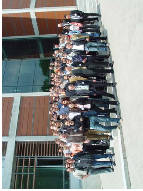
Teilnehmer des HSK 2006 vor dem IPC.

Beginn: Mittwoch 14. Mai 2008, 9:00 Uhr.